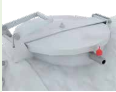
Deckel Ø 450 mm mit Schnellöffnung und Dichtungsring.