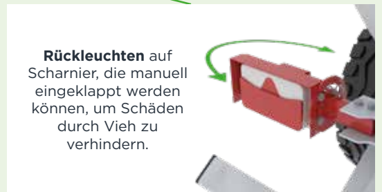
Rückleuchten auf Scharnier, die manuell eingeklappt werden können, um Schäden durch Vieh zu verhindern.