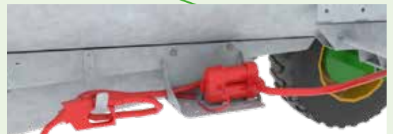
Elektrisch angetriebene 12 V Pumpe – einschließlich Düse mit Zähler und 4 m Schlauch 1".