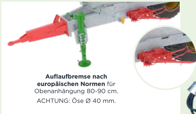
Auflaufbremse nach europäischen Normen für Obenanhängung 80-90 cm. ACHTUNG: Öse Ø 40 mm.