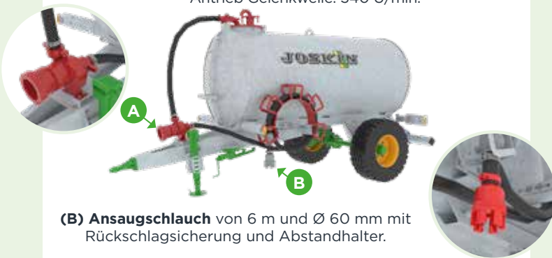
(B) Ansaugschlauch von 6 m und Ø 60 mm mit Rückschlagsicherung und Abstandhalter.