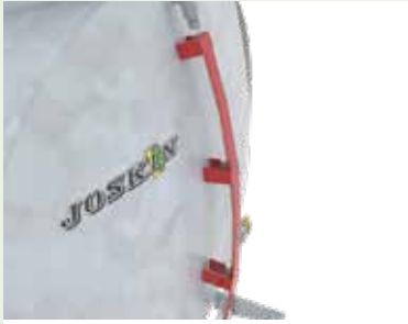
Füllstandsanzeiger vor Tieren geschützt.