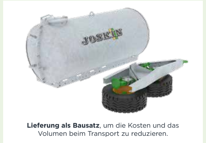
Lieferung als Bausatz , um die Kosten und das Volumen beim Transport zu reduzieren.