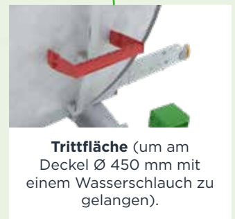
Trittfläche (um am Deckel Ø 450 mm mit einem Wasserschlauch zu gelangen).